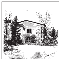
Evangelisches Gemeindehaus Vogelsangplatz