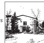
Ev. Gemeindehaus Vogelsangplatz